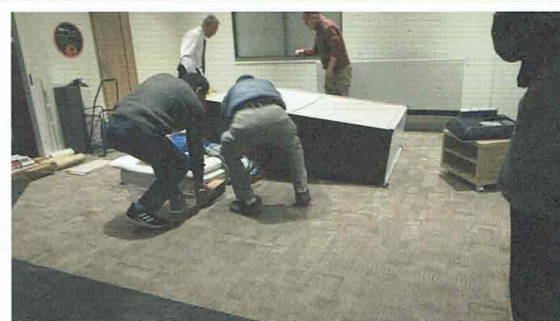
たんすの下敷きになった人を救助