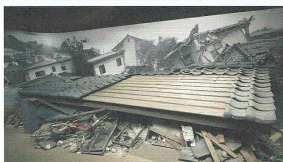
家屋倒壊現場での救出救助