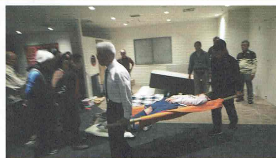
毛布を担架にしてのけが人の搬送

今起きるかもしれない『立川断層帯地震』や『首都直下地震』…地域一帯が被災地になり、普段通りの公的援助は期待できません。