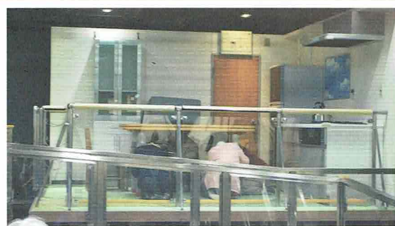
地震体験室で大地震！