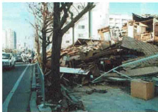
1階部分がわからないほど倒壊した家屋

阪神・淡路大震災で亡くなった人の大部分は「圧死」(約3/4)、「焼死」が約1割でした。