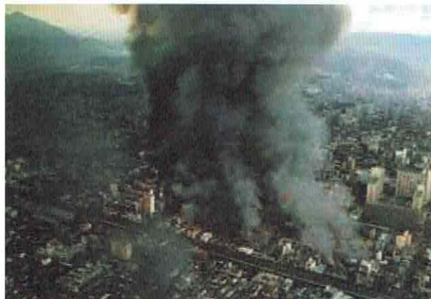
炎上する市街地から立ちのぼる黒煙